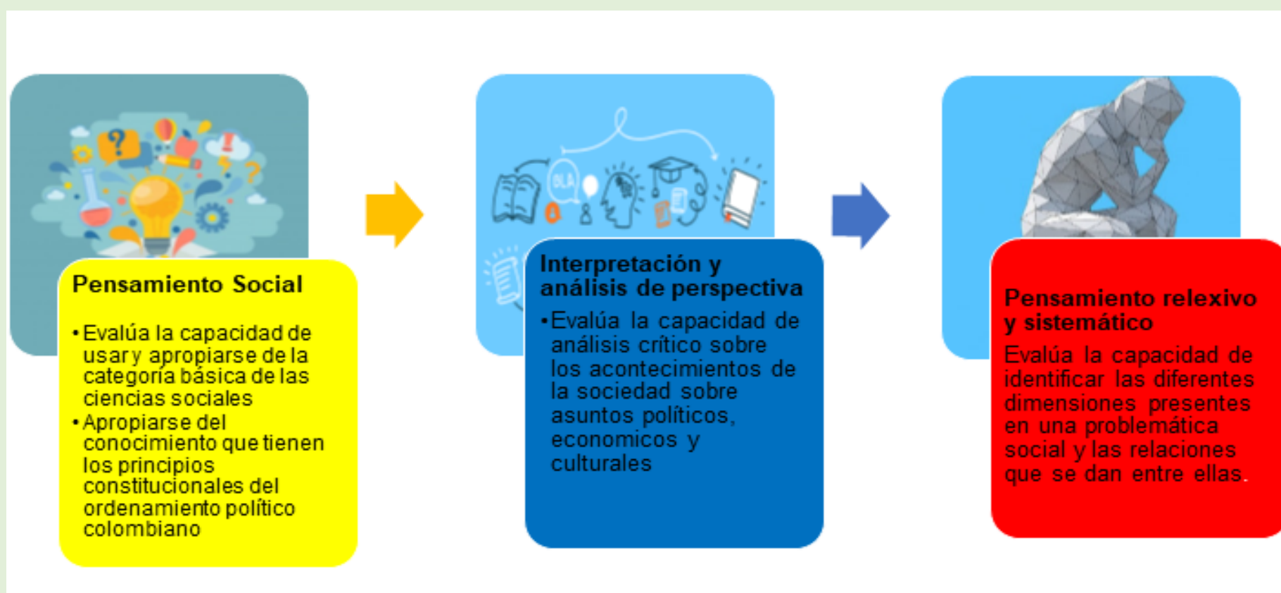
Figura 1 Competencias del área de ciencias sociales

Teniendo en cuenta que la institución se rige bajo los principios del humanismo, conocimiento, proyección y con el lema de apostarle a la transformación del ser desde su proyecto de vida, el área entra en consonancia en el desarrollo de las competencias específicas las cuales se pueden contemplar en la figura 1: competencias del área de ciencias sociales, que posibilitan una convivencia armónica una formación humana e incluyente inspirada desde los fundamentos de la pedagogía socio-crítica que favorezca el desarrollo de competencias personales, comunicativas, académicas y tecnológicas para desempeñarse exitosamente en la sociedad con alto compromiso en la transformación del entorno y el mejoramiento continuo.